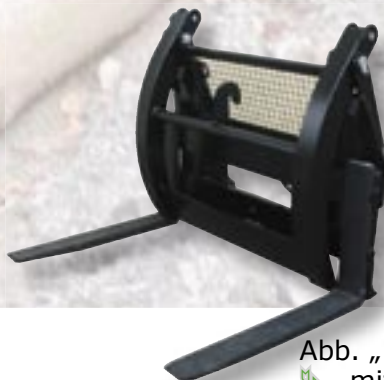
Abb. „HGZ“ mit eingeschweißtem Schutzgitter