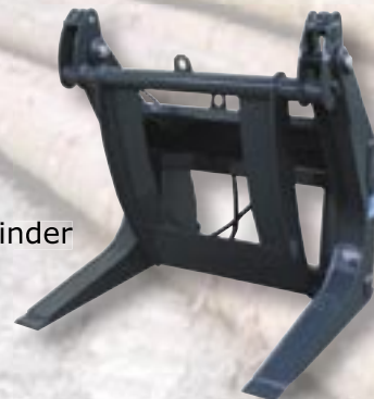
Abb. „HG-RK“ ↗ mit optimaler Öffnungsweite

Die Greiferform ermöglicht die einfache und präzise Aufnahme einzelner, aber auch mehrerer Stämme.