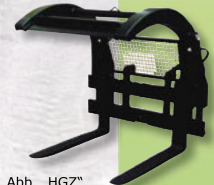
Abb. „HGZ“ mit optimaler Öffnungsweite