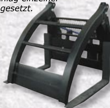
Abb. „HGZ“ Greifer schließt „vorne“ auf den Gabelzinken (auf Wunsch)