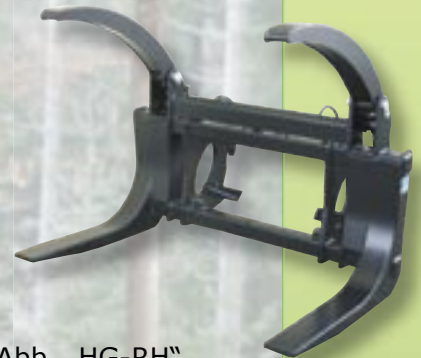
Abb. „HG-RH“ mit optimaler Öffnungsweite