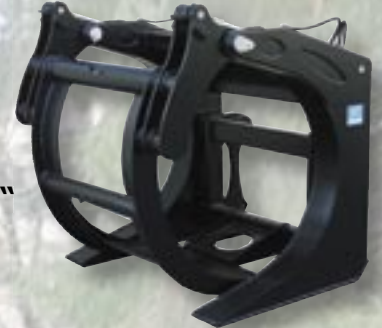
Abb. „HG-RV“ ↗ mit optimaler Öffnungsweite

Durch den optimal geformten Greifer kann eine große Anzahl an Stämmen aufgenommen werden. Das Klemmen von Einzelstämmen ist nicht möglich.